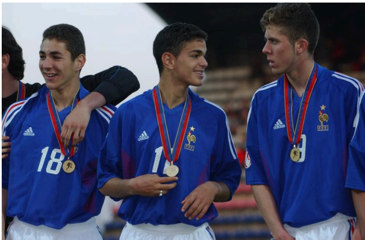
Karim Benzema, Hatem Ben Arfa et Jérémy Ménez lors du sacre de l'équipe de France U17 à l'Euro 2004.